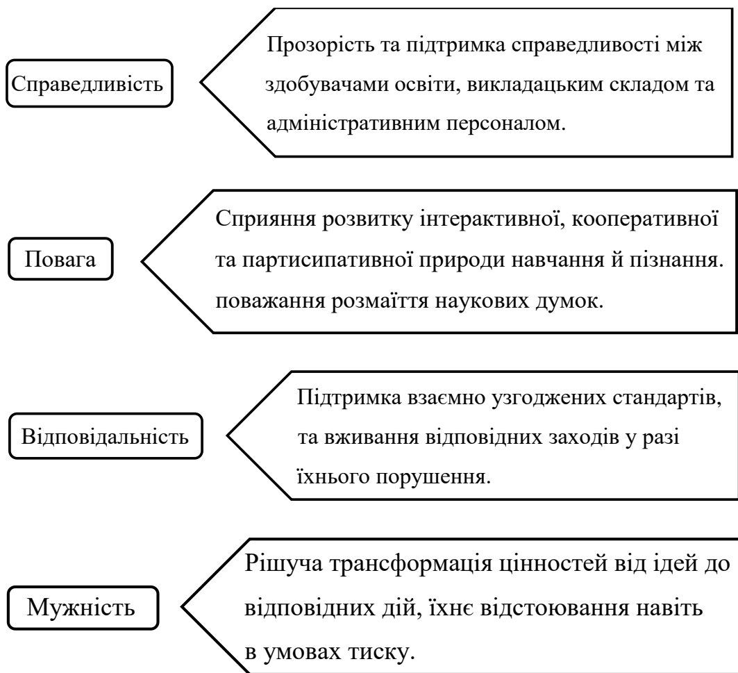
Рисунок 1. – Фундаментальні цінності академічної доброчесності.

Зазначимо основні терміни, що застосовуються при розгляді поняття «Академічна доброчесність».