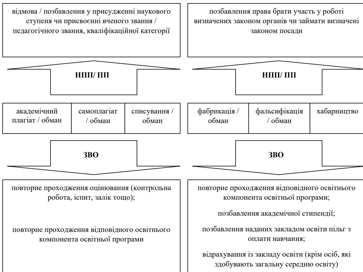
Рисунок 1 – Найпоширеніші наслідки за фактом порушення видів АД.

АД є багатогранним поняттям, але одним із розповсюджених проявів її недотримання, як було зазначено раніше у тексті роботи, сьогодні вважається плагіат та самоплагіат. де – НПП/ ПП – науково-педагогічні/ педагогічні працівники; ЗВО – здобувачі вищої освіти.